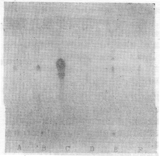
图 2 五个样品两步展开的薄层层析 A. B126; B. 74-26; C. 对照; D. 75-110; E. B22; F. B92

Zinadze 试剂呈阴性。从而证明,菌株 B126 和 74-26 产生的表面活性剂均为糖脂。