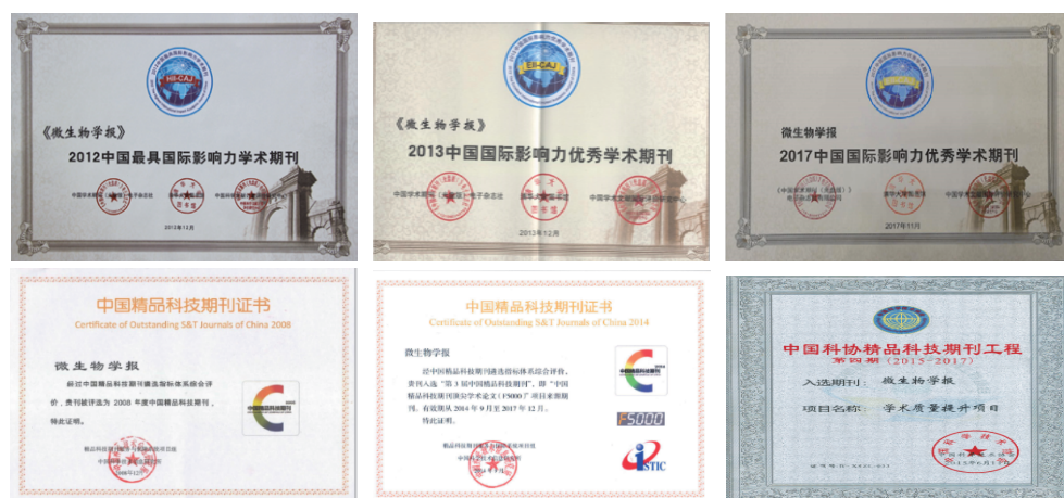
图 3. 《微生物学报》近年来获得的部分奖项

《微生物学报》取得的所有成绩都离不开主办单位中国科学院微生物研究所的支持与帮助,《微生物学报》始终关注着微生物研