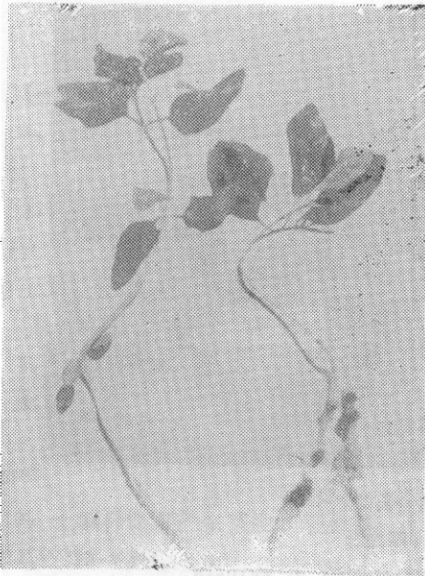
图2 土壤杆菌素产生菌悬液预浸向日葵幼苗根部对根瘤诱发的抑制作用

Fig. 2 Gall inhibition on sunflower seedling by dipping the roots in the cells suspension of agrocin-producing strains