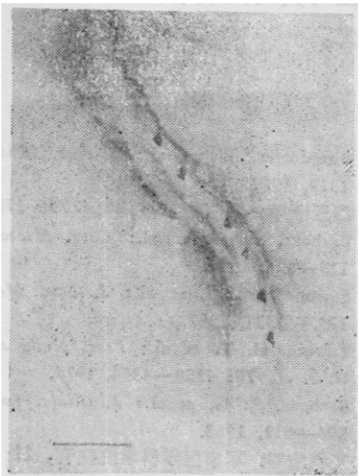
图 2 H7 株细胞尖锐的末端和鞭毛 (箭头示鞭毛插入点, \times 35000 )