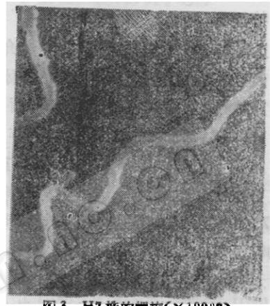
图 3 H7 株的螺旋( \times 10000 )

H7 株细胞平均长度为 15.4\mu\text{m} , 中间宽 0.19\mu\text{m} , 两端渐细, 末端尖锐, 有数个不规则的波, 通常为 4—6 个波, 以中间波最长, 靠近两端渐小, 中间波平均长 2.35\mu\text{m} , 波幅 0.84\mu\text{m} 。在负染照片上, 外套为一层清晰光滑的轮廓线, 与原生质柱之间的界线分明。两末端鞭毛均为 7 根(图 2), 根据其插入点可以准确计数, 插入点介于外套与原生质柱之间, 第一和第七根鞭毛的插入点距顶端分别为 0.41—0.50\mu\text{m} 和 1.45\mu\text{m} 。在扫描照片上可以观察到左旋方向的螺旋(图 3), 未见右旋螺旋。在螺旋体纵横切面上, 细胞内部结构致密, 有均匀分布的较高密度的颗粒, 无空泡。观察到分裂状态的螺旋体(图 4), 原生质柱