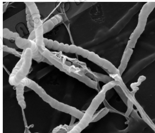
图 1 菌株 Lj20 的孢子丝特征(10000×)

2.1.1 形态特征: 菌株 Lj20 革兰氏染色阳性; 在高氏合成 1 号和燕麦等培养基上生长 7 d, 孢子丝长, 直或柔曲; 孢子卵圆形至椭圆形, 表面光滑 (图 1)。